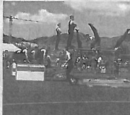
Aktivriege am kantonalen Turnfest.