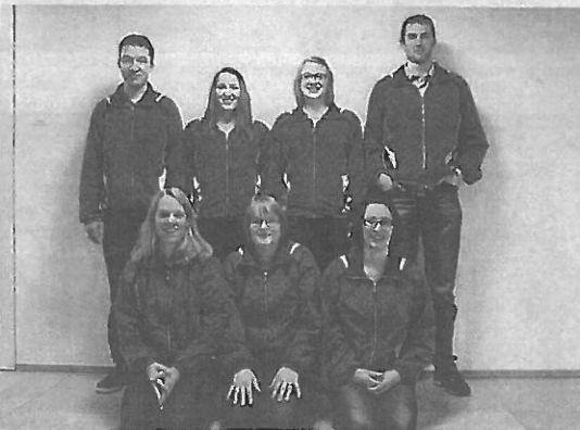
Der Vorstand des Turnvereins Waldstatt.