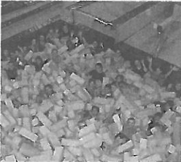
Getu Waldstatt weich gelandet.