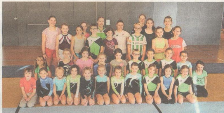
Die Getu Waldstatt durfte ein spezielles Trainingsgeschenk einlösen.